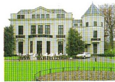
Het Huis Avegoor in Ellecom